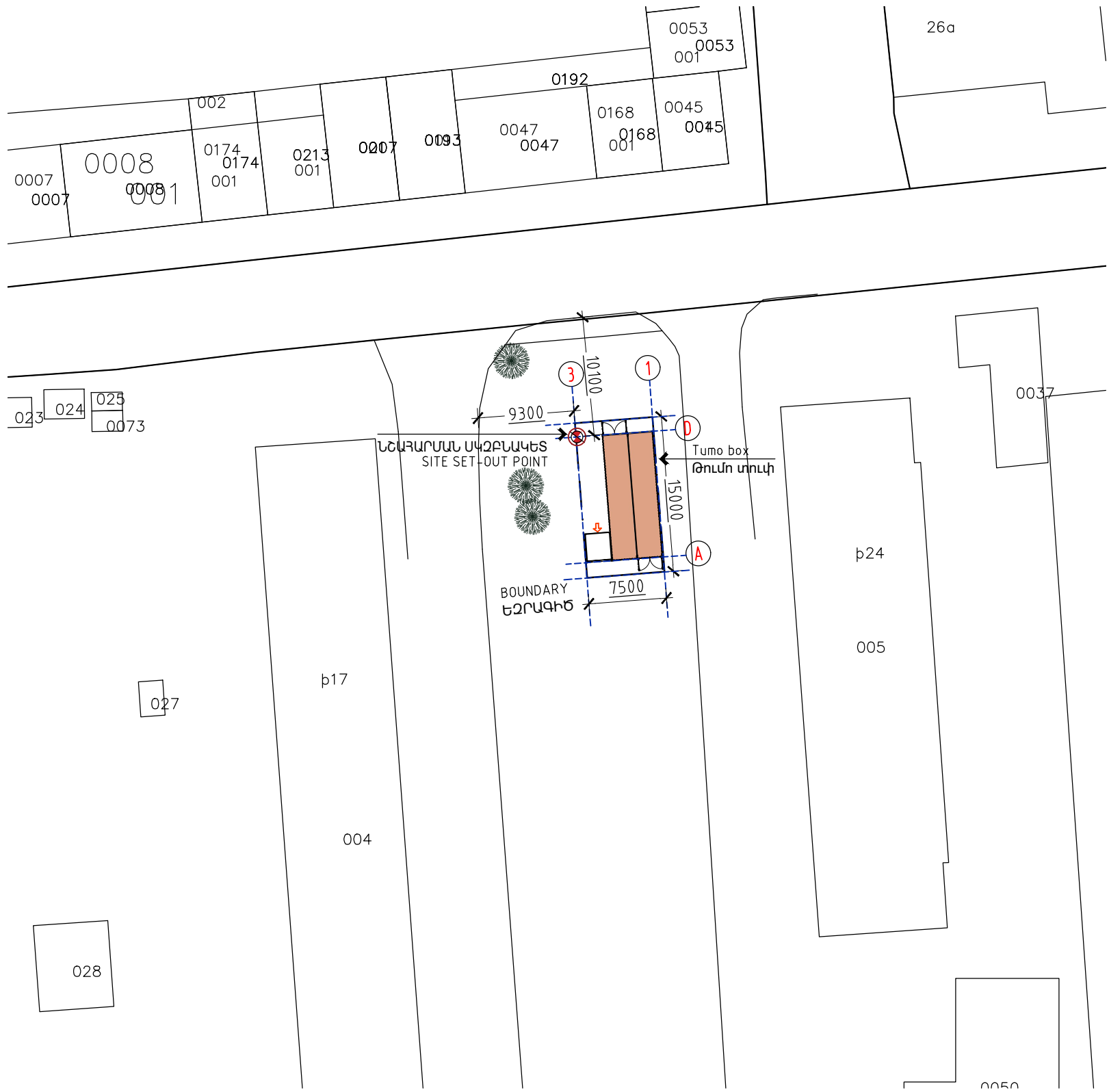
1 ՏԵՂԱՆՔԻ ՀԱՏԱԿԱԳԻԾ 1 SITE SETOUT 1:500@ A3